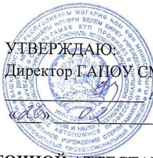
ГРАФИК ПРОМЕЖУТОЧНОЙ АТТЕСТАЦИИ на второе полугодие 2023-2024 учебного года 09.01.01 Наладчик аппаратного и программного обеспечения